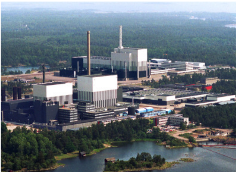
Švédská jaderná elektrárna Oskarshamn

Švédská vláda v únoru oznámila, že hodlá pokračovat v rozvoji jaderné energetiky. K tomu bude nutné zrušit zákaz výstavby nových reaktorů, který zde platí téměř 30 let. V souvislosti s jadernou havárií v elektrárně Three Mile Island bylo v kuriozním referendu (všechny varianty odpovědi byly protijaderné(!)) rozhodnuto o zastavení rozvoje jaderného průmyslu a následně bylo schváleno moratorium na vybudování dalších reaktorů. Pokud současný vládní návrh projde parlamentem, je pravděpodobné, že v budoucnu bude moci Švédsko využívat energie z nových reaktorů postavených v místech současných fungujících elektráren. Nyní Švédsko provozuje deset jaderných reaktorů v elektrárnách Oskarshamn, Ringhals a Forsmark